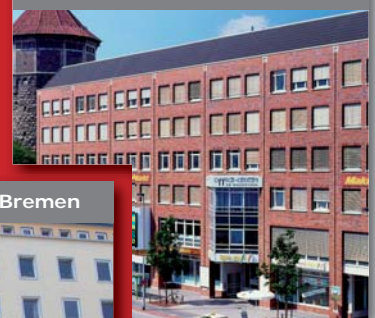
ecos office center, Hannover